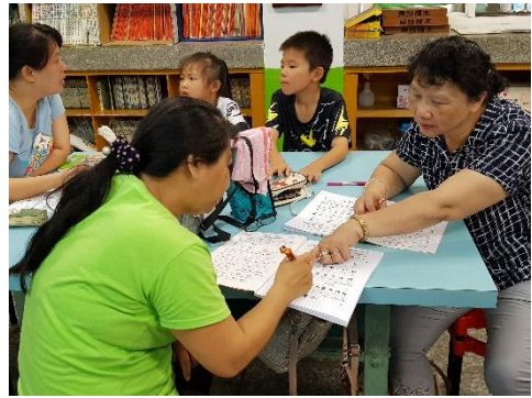
同學認真討論，學客語盡煞猛！