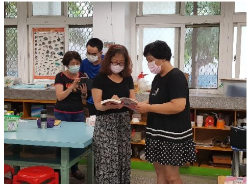
下課還在討論上課內容，盡認真！