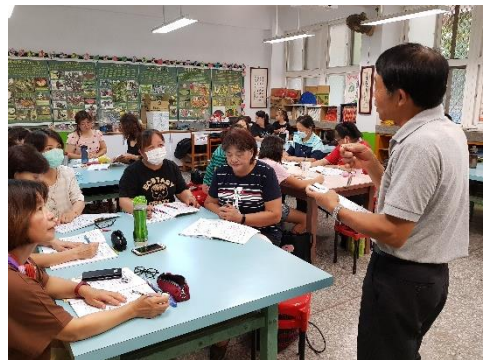
先生範念，同學擎手問， 先生精彩回答