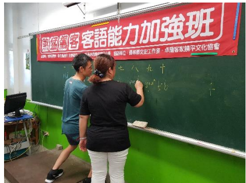
對生活平常字學寫拼音