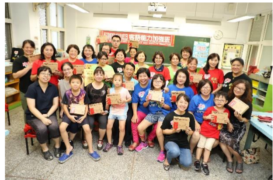
靜修國小饒平客語班圓滿成功， 勞力先生，大家當慶！