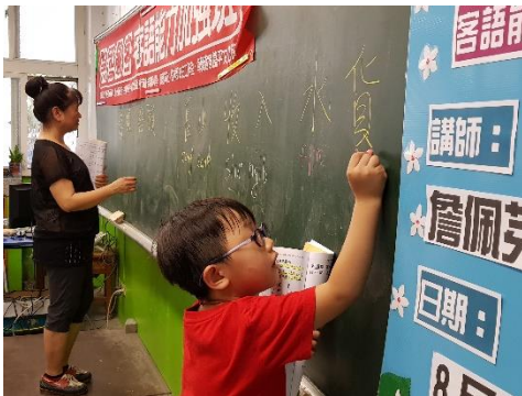
新竹饒平腔與彰化饒平腔 轉換練習，細朋友乜會。