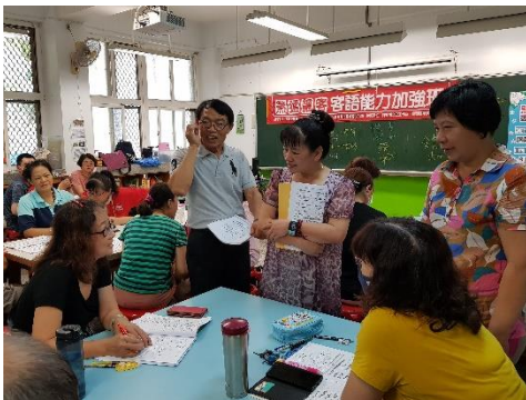
同學輪流照樣造句，練習口語表達， 先生阿謔大家恁會哦！