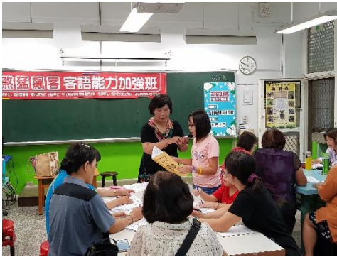
細朋友雖然無幾歲也唸當好，當港！