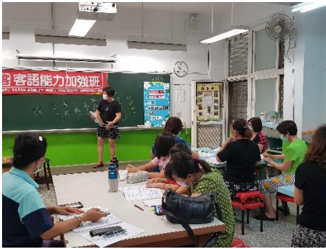
同學跔等先生把諺語融入作文技巧練習