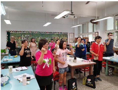
〈大家來運動〉唱唱跳跳， 提高精神，迎接下晝精彩个客語課