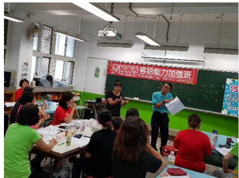
華轉客練習，先生回應同學提問，補充「一比弓蕉」在不同腔調个講法